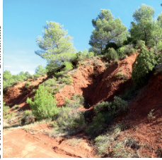
OTI du Terroir Saint-Chinianais