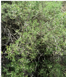
OTI du Terroir Saint-Chinianais