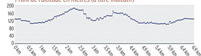
Profil de l'altitude en mètres (à titre indicatif)

8. 106 m, 31 T 485839 4798398 Emprunter le sentier montant vers la droite et longeant le mur. Au village, aller tout droit, puis tourner à gauche sous la voûte vers la place Ste Blaise. Descendre vers la place du Café, poursuivre tout droit puis prendre à droite rue du Cercle. Regagner le rond-point et le parking.