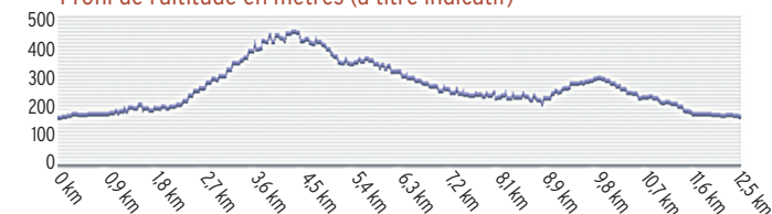
Profil de l'altitude en mètres (à titre indicatif)