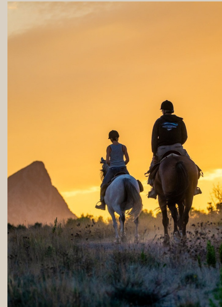
Forfait 3/4 journée