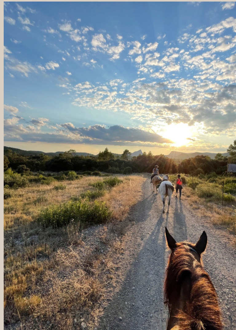
Forfait 1/2 journée